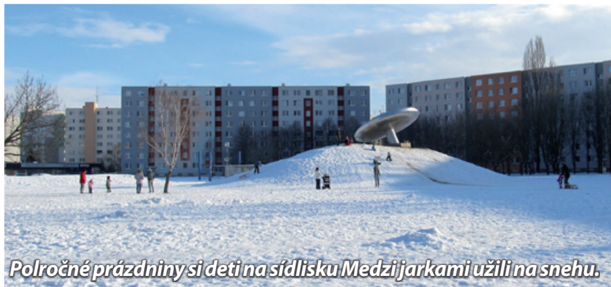
Polročné prázdniny si deti na sídlisku Medzijarkami užili na snehu.