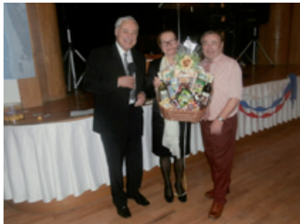
Šťastná výherkyňa ceny, ktorú venovala starostka mestskej časti.

Už tradične sa vydaril. Napriek tomu, že obdobie fašiangov už dlhšiu dobu trvale súperí s nástupom rôznych chrípkových a iných ochorení, účasť našich spoluobčanov chtivých po dobrej zábave na plese, bola uspokojujúca. Zážitky z plesu určite mnohým umocnili dobrá hudba a tiež pohostenie, o ktoré sa postarala reštaurácia Vetvár.