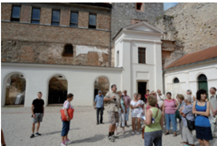
Várpalota ódon falainál.

Nagyon régen adtuk hírrül a Püspöki Újság hasábjain, hogy a Csemadok pozsony-püspöki alapszervezete él és virul. 2015 január 18-án tartottuk helyi szervezetünk évzáróját a Vetvár kultúrházban amely zsűfolásig megtelt, kevés volt az előkészített helyek száma, ezért további székeket kellett beraknunk a terembe. Látvá a nagy érdeklődést úgy gondoltuk mások is szerezzenek tudomást erről a találkozóóról, az ott elhangzottokról, ezért élünk az informálás újságon keresztüli lehetőségével. A tevékenység taglalásán túl ebben a formában is megköszönjük a vezetőség áldozatos,