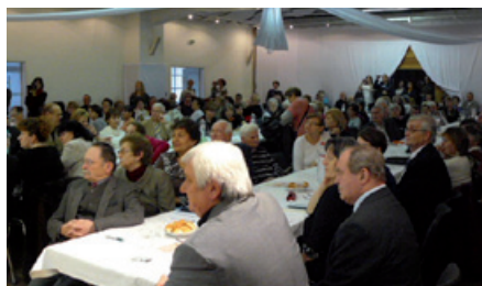
Členovia ZO Csemadok.

V druhej skupine evidujeme programy, ktoré sú aktuálne v schválenom programe činnosti základnej organizácie na daný rok. V minulom roku to bola okrem iných Výstava Sándora Máraia v Cezhraničnom impulznom a informačnom centre, návšteva našich priateľov z Českého a moravského zväzu Maďarov v Brne, organizácie, s ktorou máme uzavretú zmluvu o spolupráci.