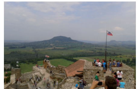
Csoportunk a szigligeti várban.