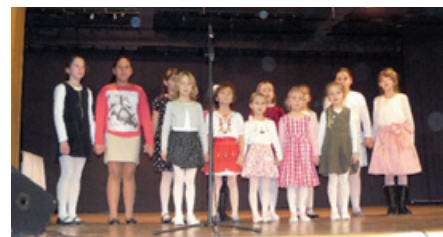
Žiaci Základnej školy Vetvárska.