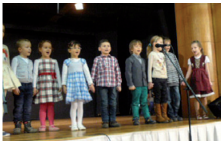
Deti z Materskej školy Staromlynská. Óvodások műsora.

Veľa času uplynulo odvtedy, čo sme v Biskupických novinách písali o činnosti Základnej organizácie Csemadok pôsobiacej v našej mestskej časti. V polovici januára sme mali v Dome kultúry Vetvár výročnú členskú schôdzu a ako to už pri takejto príležitosti býva, sála sa naplnila do prasknutia, bolo treba pridať ďalšie stoličky. Takýto záujem nás povzbudil, aj preto sme sa rozhodli informovať našich spoluobčanov o aktivitách a činnosti našej organizácie, o tom, čo odznelo na schôdzi. Zároveň sa poďakovať vedeniu za húževnatú prácu a členom našej organizácie za záujem o kultúrne a spoločenské podujatia, ktoré pre nich pripravujeme.