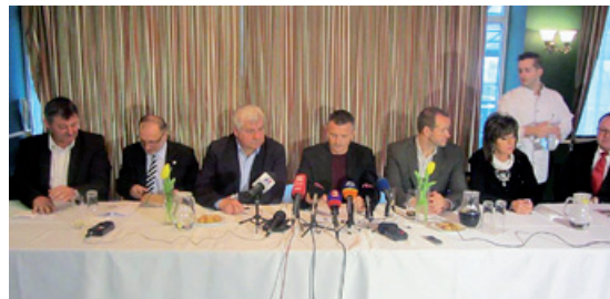
Z tlačovej besedy po stretnutí starostov s ministrom dopravy Jánom Počiatkom.