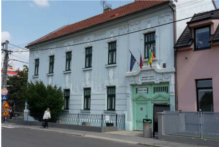
Miestny úrad mestskej časti Bratislava-Podunajské Biskupice na Trojičnom námestí 11.

Mestská časť Bratislava-Podunajské Biskupice je samostatný územný samosprávny a správny celok Bratislavy. Mestská časť Bratislava-Podunajské Biskupice je právnickou osobou, ktorá samostatne hospodári s majetkom a s príjmami v zmysle platnej legislatívy. Základnou úlohou mestskej časti Bratislava-Podunajské Biskupice pri výkone samosprávy je starostlivosť o všestranný rozvoj jej územia a o potreby jej obyvateľov.